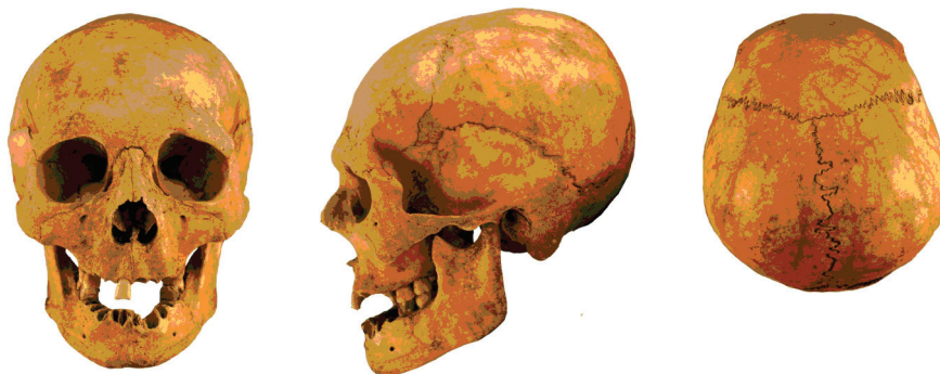
Рис. 3. Череп из кургана 11 погребально-поминального комплекса «Курган 37 воинов». Фото

Сравнение между собой имеющихся черепов тасмолинской археологической культуры показывает относительную неоднородность выборки, смешение как минимум на уровне нескольких поколений европеоидного и монголоидного (или уже смешанного европеоидно-монголоидного) населения. Однако в основе имеющейся серии тасмолинских черепов ядро составляют именно черепа подобного антропологического облика (близкого рассмотренному нами черепу из кургана 11 погребально-поминального комплекса «курган 37 воинов»).