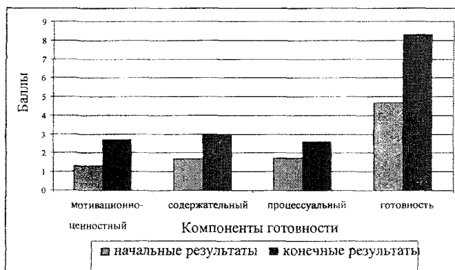
Гистограмма 2. Изменения в компонентах готовности учителей в ЭГ-2

Гистограмма 2 представляет изменения, произошедшие в компонентах готовности в ЭГ-2. Согласно экспериментальных данных, наблюдается рост степени выраженности всех компонентов готовности учителя. Данный факт доказывает успешность реализации модели и достаточность выявленных условий для достижения цели модели. Анализ результатов показывает, что реализация гипотезы в ЭГ-2 приводит к достижению цели: повышению готовности до уровня «выше среднего».