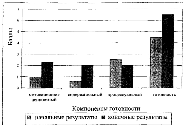
Гистограмма 1. Изменения в компонентах готовности учителей в ЭГ-1

помощи консультантов, более опытных коллег, опираясь лишь на свои опыт и знания.