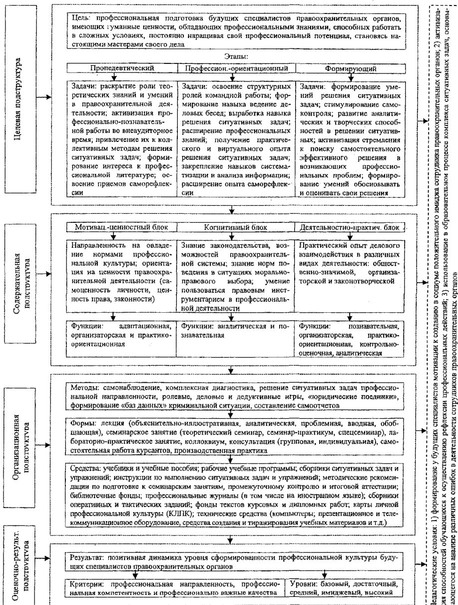
Рис. 1. Модель формирования профессиональной культуры будущих специалистов правоохранительных органов