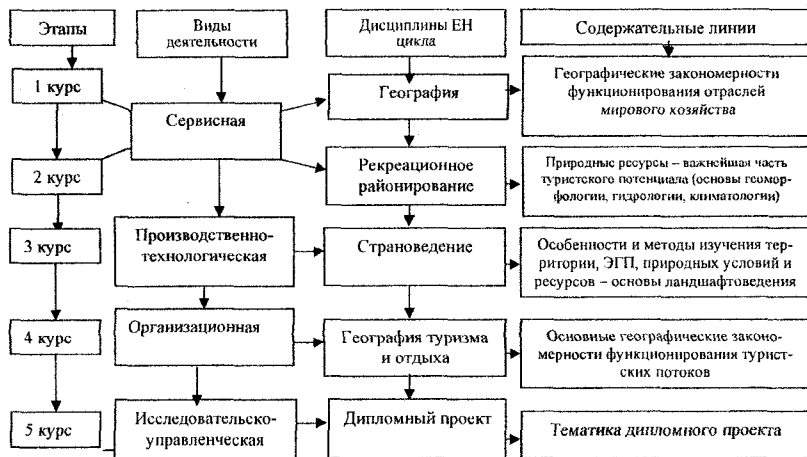
Рис. 4. Содержательная модель формирования профессиональных компетенций специалиста туристической индустрии в структуре географических дисциплин

Всю содержательную структуру оптимизации формирования профессиональных компетенций при изучении естественнонаучных дисциплин можно представить схематически (рис. 4).