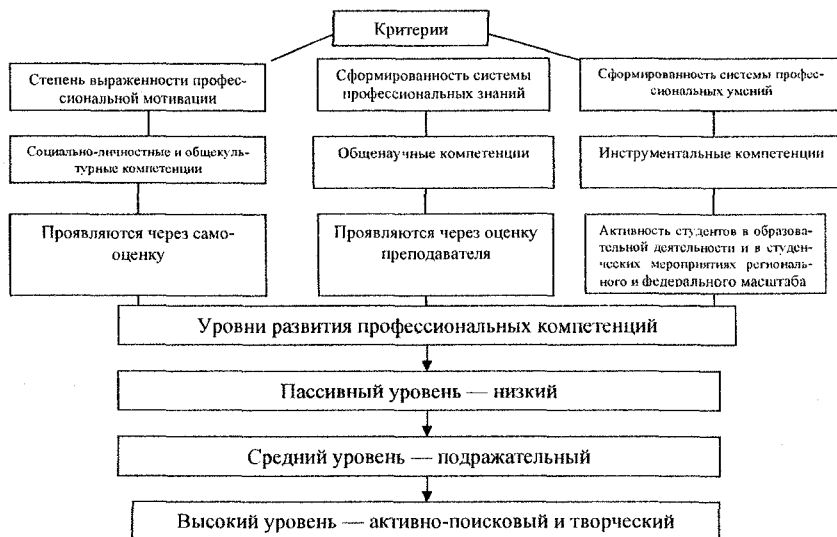
Рис. 2 . Критерии и уровни развития профессиональных компетенций