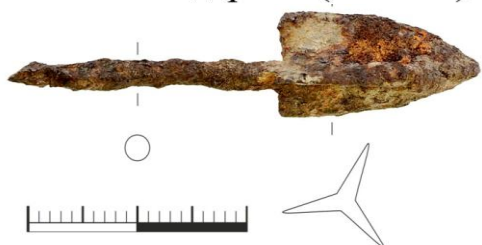
Рис. 4. Наконечник стрелы из музея с. Тамьян-Таймас