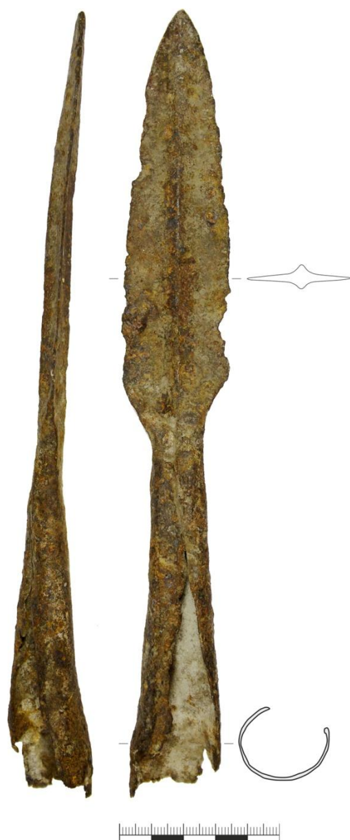
Рис. 2. Наконечник копья из с. Зильдярово (копье 2)

го района (рис. 1–3) использовались и в более позднее время. Для уточнения времени их использования необходимо привлечение большего числа аналогий и специальные исследования.