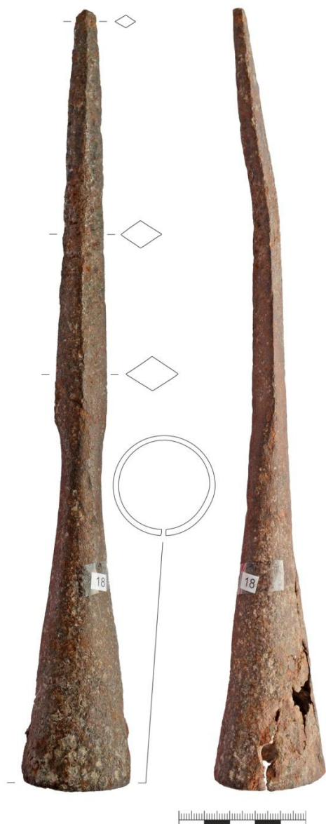
Рис. 1. Наконечник копья из с. Биккулово (копье 1)

копья обнаружено в насыпи кургана 7 Каранаевского могильника, который датируется IX–XI вв. и погребении Мрясимовского кургана 15 XI–XII вв. [10, с. 115, рис. 61, 16; с. 154, рис. 75, 8]. В целом, их распространение относится ко второй половине I тыс. н. э. и связано с развитием тяжелого вооружения [14, с. 157]. Таким же временем, а скорее всего и шире, следует датировать копья с линзовидным и двухлопастным в сечении пером (рис. 2–3). Они предназначались для поражения легковооруженного воина. В качестве примеров ближайших территориальных аналогий приведем копье из г. Уфы, с листовидной головкой, отнесенное к вещевому комплексу турбаслинской культуры V–VII вв. [13, с. 73, 74, рис. 12, 8], а также из I Большетарханского могильника VIII–IX вв. [7, с. 48, 49, 56, рис. 11, 48]. Не исключено то, что формы копий, аналогичные копьям из музеев Миякинско-