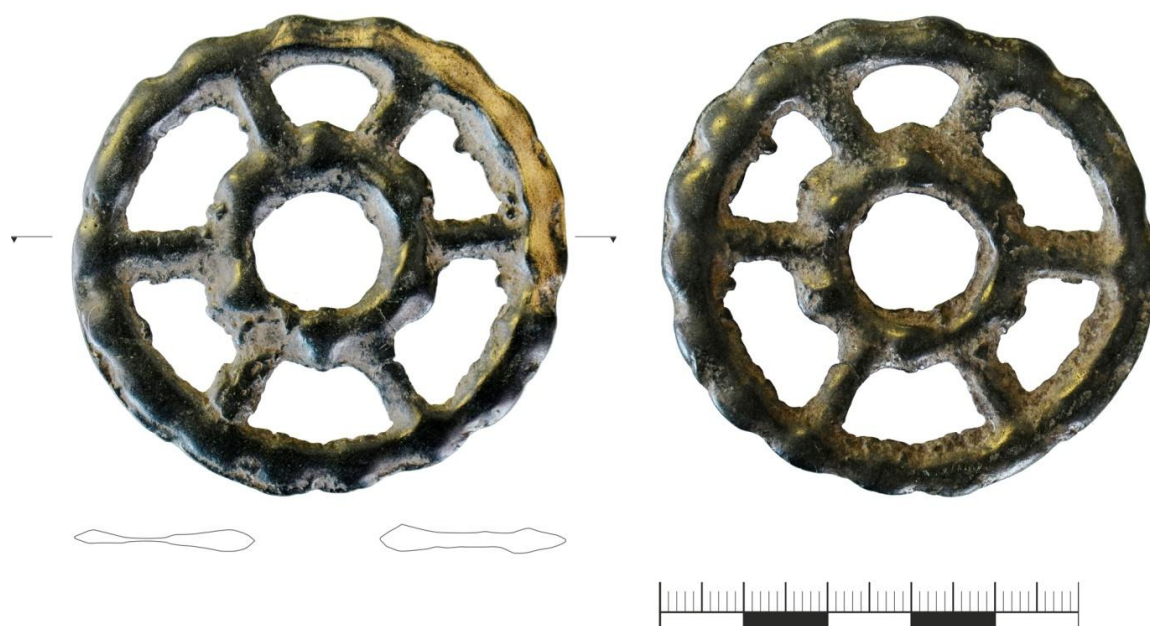
Рис. 5. Колесовидная подвеска из музея с. Тамьян-Таймас

Другая аналогия колесовидному украшению известна из материалов Бирского могильника. Здесь оно атрибутировано как женское украшение (нагрудная подвеска) и датируется V–VII вв. [11, с. 25]. В Лагеревском кургане 46 (погребение 2) обнаружены две «круглые подвески с выпуклинами по краю», выполненные проще (без внутреннего круга и без спиц), но, несомненно, имеющая стилистическое сходство с украшением из Тамьян-Таймаса. Указанное погребение Лагеревского кургана 46 датируется VII – VIII вв. [10, с. 27]. Наконец, кольца с выпуклинами по краю представлены в ряде погребений Коминтерновского II могильника (Куйбышевское водохранилище) второй половины VI в. н. э. [8, с. 131, 135, 137, рис. 19, 1; 23, 5; 25, 20]. Таким образом, датировка колесовидной подвески из Тамьян-Таймаса тяготеет к третьей четверти I тыс. н. э.