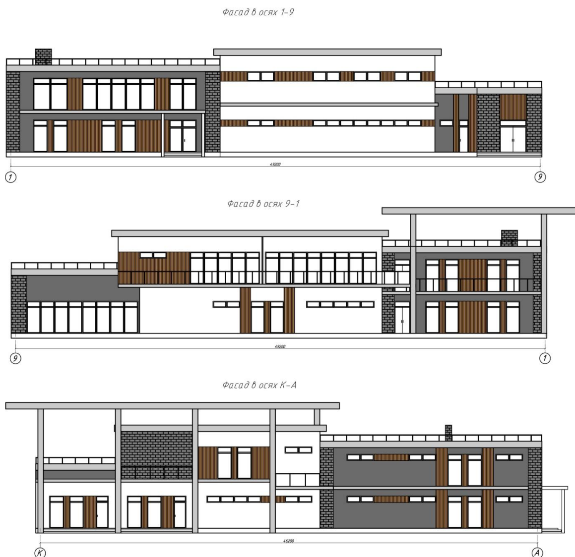
Рис. 3 Варианты фасадов физкультурно-оздоровительного комплекса

Для данных видов физической деятельности должны быть учтены определенные требования к качеству отделки поверхностей и оснащению инвентарем. Например: зеркальные стены для того, чтобы занимающиеся могли контролировать свои движения; хореографический станок и набор спортивного оборудования для выполнения силовых упражнений (степ-платформы, гантели, бодибары, фитболы, коврики). Следует учитывать, что при занятиях аэробикой необходимо специализированное напольное покрытие, которое имеет небольшой воздушный зазор, чтобы сделать пол пружинящим и предохранять от травм. Покрытие пола для залов фитнеса должно обладать и другими важными свойствами: быть бесшумным, экологически безопасным, устойчивым к воздействию влаги, удобным для чистки и мытья.