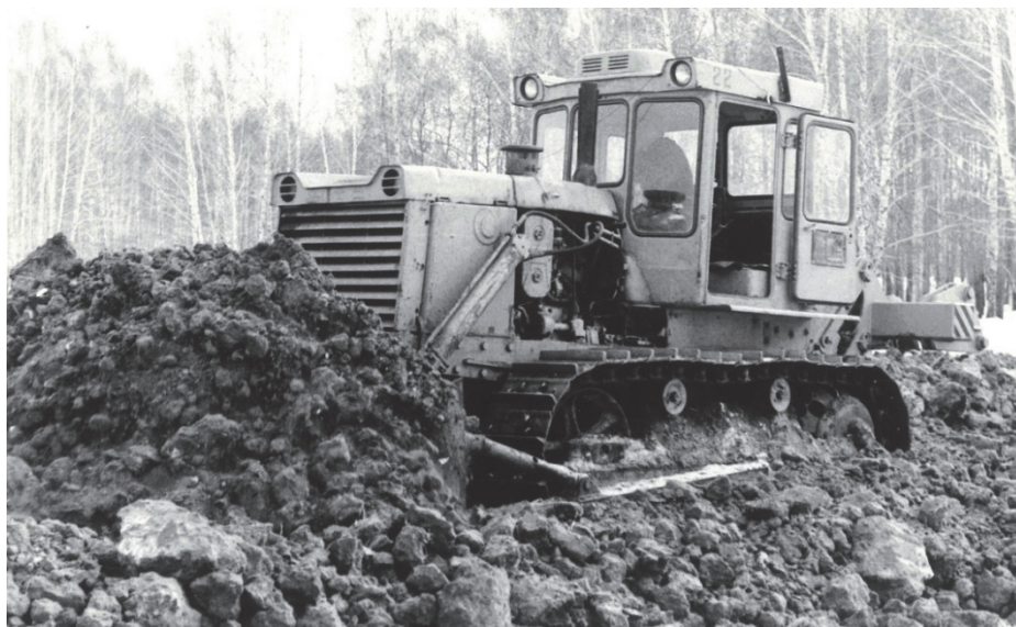
Рис. 3. Фрагмент испытаний трактора на бульдозерно-рыхлительных работах

в которой a , b , c – эмпирические коэффициенты; f_d = P_k / G_a – удельная сила тяги на ведущих колёсах. Л.В. Сергеев [3] при условии нормального (среднего) натяжения гусеничных цепей для армейских гусеничных машин рекомендует следующие значения коэффициентов a , b , c соответственно: 0,025; 0,05; 3 \cdot 10^{-6} .