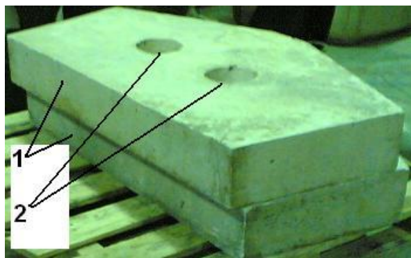
Рис. 3. Новый огнеупорный элемент СРП – блок разливочной камеры (порог) с двумя пространственно ориентированными отверстиями: 1 – порог; 2 – ряд переливных отверстий блока

С учетом зависимостей (3), (4) коэффициент равен k_u = 1,5 .