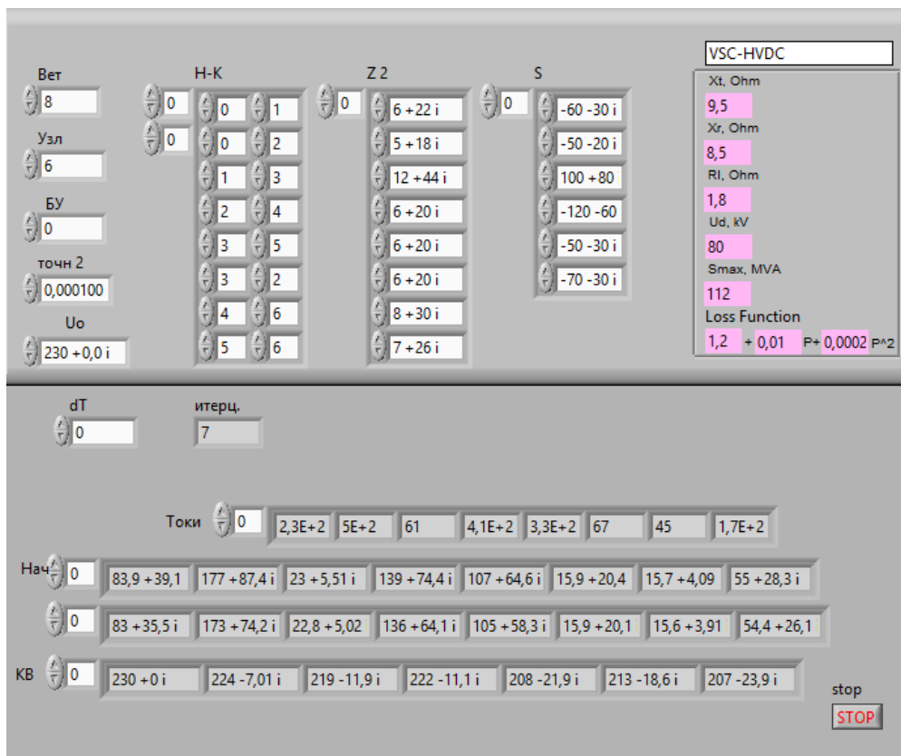
Рис. 2. Исходные данные в программе Labview