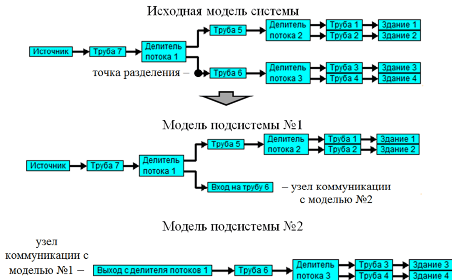
Рис. 1. Структурное разделение исходной модели на подсистемы

Модель теплоснабжения зданий может быть достаточно большой или отдельные ее блоки могут быть достаточно сложными, но в общем случае в системе есть источники, соединительные элементы (трубопроводы, трубопроводные тройники и т. д.) и потребители. Рассмотрим принцип разбиения модели, построенной, например, в среде имитационного моделирования VisSim согласно методике, описанной в [4, 5] (рис. 1).