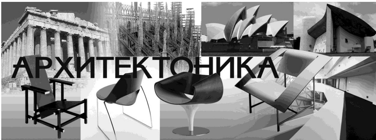
Рис. 2. Архитектоника

Особенно важен вопрос различения понятий «тектоника» и «архитектоника». Беглое филологическое сравнение терминов сразу подсказывает, что между ними лежит та грань, которая отделяет «строительное искусство» от архитектуры как искусства просто, без уточняющей приставки. По-видимому, именно на границе этих понятий архитектура становится «музыкой, застывшей в камне».