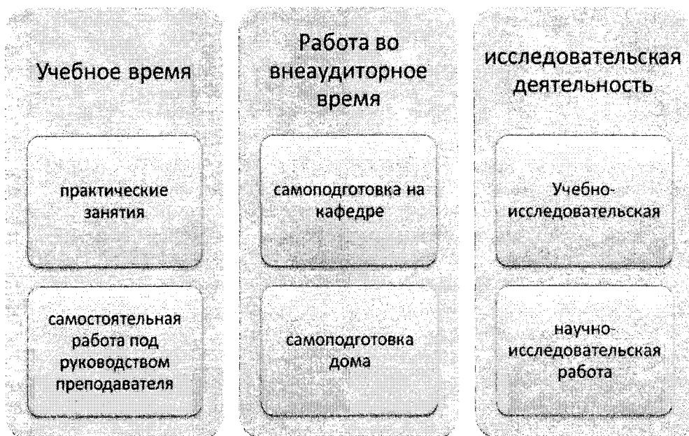
Рис. 2. Виды самостоятельной работы студентов при становлении вторичной языковой образованности

Для фиксации успеваемости и результатов самостоятельной работы, считаем необхо-