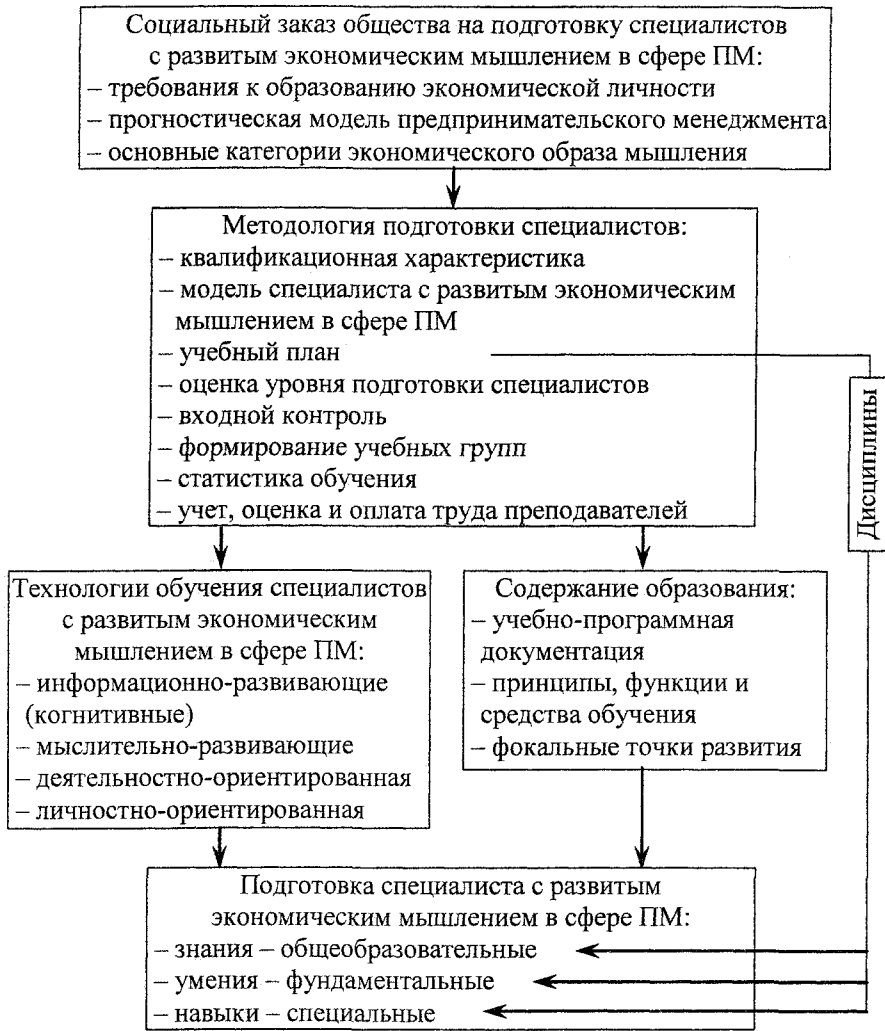
Рис. 1. Модель развития предпринимательского мышления в процессе обучения менеджеров

Состав группы по количеству был равным. В состав экспериментальной и контрольной групп входило по 60 студентов. В начале эксперимента было проведено «персональное тестирование менеджера». Результаты были примерно равными в обеих группах. Они определяют исходные величины (в баллах) четырех параметров личности. Речь идет о ее «силе» в качестве производителя, инициатора, интегратора и администратора.