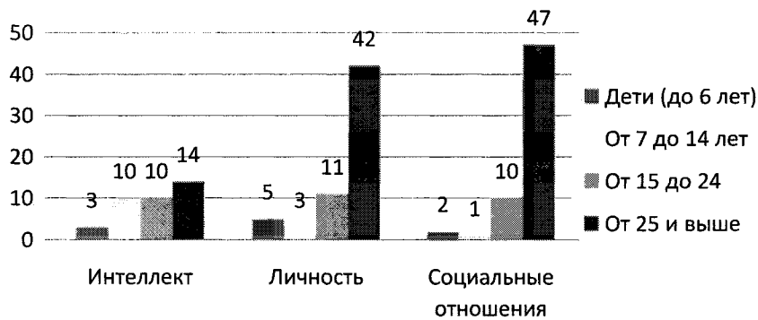
Рис. 2. Количество методик психодиагностики интеллекта, личности и социальных отношений для отдельных возрастных групп (шт.)

По данным Компендиума наиболее обеспечена методиками исследования интеллекта (14 методик), личности (42 методики), и социальных отношений (47 методик) категория взрослых людей (от 25 лет) (см. рис. 1). Наименьшее количество методик психодиагностики личности и социальных отношений в Компендиуме для детей до 6 лет и 7–14 лет. Обеспеченность разных возрастных групп методиками психодиагностики интеллекта выглядит наиболее однородно. Равное количество данных методик для возрастных групп 7–14 и 15–25 лет. Наименьшее количество методик исследования интеллекта в Компендиуме для детей до 6 лет.