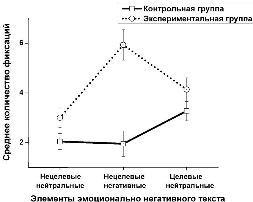
Рис. 4. Влияние типа элементов стрессогенного текста на количество зрительных фиксаций у здоровых лиц и пациентов с высоким суицидальным риском

Таким образом, исследование показало, что дисфункции когнитивного контроля, отмечающиеся у лиц с суицидальным риском в условиях воздействия стрессогенной информации, проявляются как в снижении произвольного контроля зрительного внимания, периодически «прилипающего» к стрессогенным стимулам, так и трудностях сознательного подавления нерелевантных цели деятельности мыслей и ассоциаций, нарушающих целенаправленное протекание когнитивной активности.