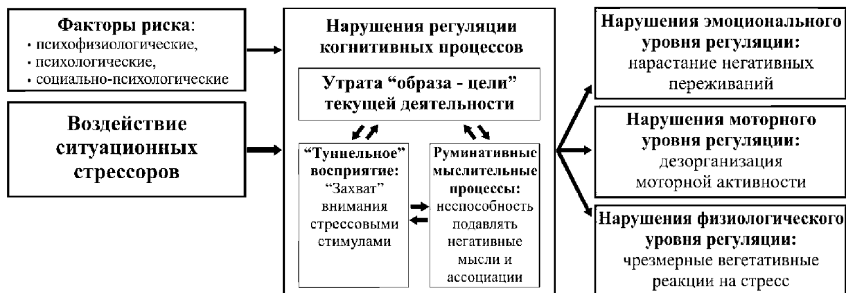
Рис. 1. Теоретическая модель нарушений регуляции когнитивной деятельности у суицидальных пациентов

В соответствии с представленной моделью воздействие специфических ситуационных стрессоров в сочетании с психофизиологическими (например, слабый тип нервной системы), психологическими (например, черты аффективной ригидности) или социально-психологическими (например, низкие коммуникативные способности) факторами риска вызывает у индивида кратковременные нарушения регуляции когнитивных процессов, утрачивающих свой целенаправленный характер. Известно, что ключевым фактором, обеспечивающим целенаправленное протекание когнитивных процессов, является активное поддержание в оперативной памяти «образа-цели» [5] текущей деятельности и связанной с ним системы когнитивных установок (cognitive task settings) [20]. Воздействие ситуационных стрессоров вызывает непроизвольную актуализацию в сознании индивида мыслей и ассоциаций негативного содержания. Этот процесс