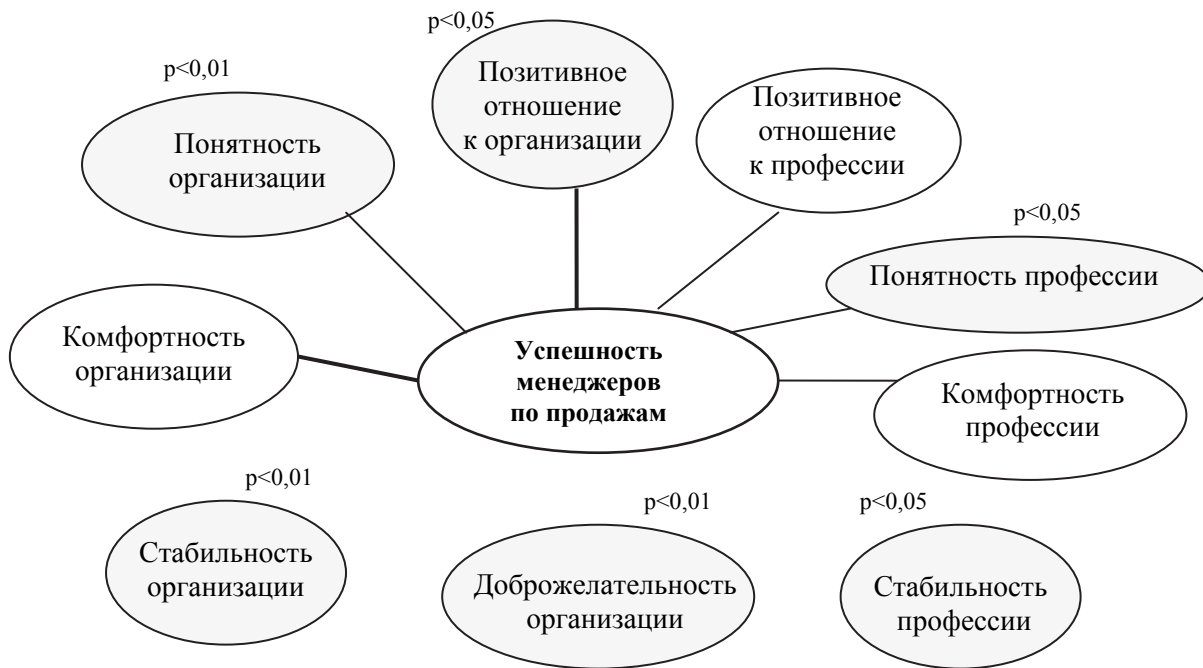
Рис. 3. Взаимосвязь успешности профессиональной деятельности менеджеров по продажам с особенностью их восприятия организации и профессии (по данным методики «Семантический дифференциал»):