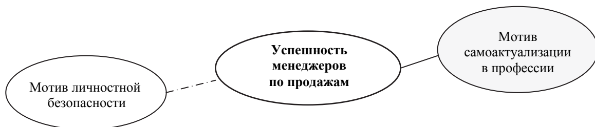
Рис. 2. Взаимосвязь успешности профессиональной деятельности менеджеров по продажам с мотивами труда:

Выявлена нелинейная зависимость между успешностью менеджеров и их оценками по всем категориям для понятия «организация» и