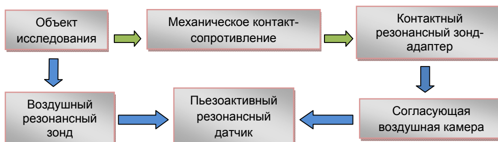
Рис. 2. Блок-схема адаптера контактного и бесконтактного типа