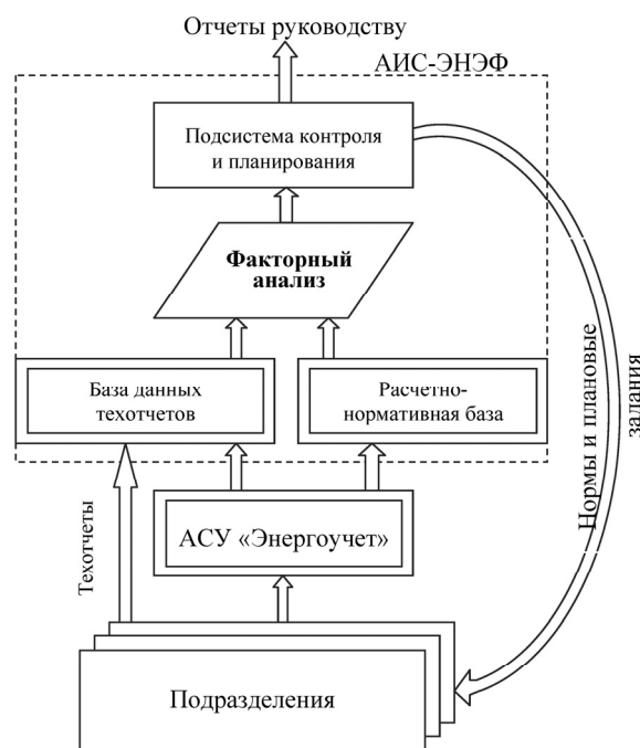
Рис. 1. Структурная схема автоматизированной системы энергетического менеджмента предприятия

Успех введения системы энергетического менеджмента предприятия существенно зависит от уровня автоматизации задач энергетического менеджмента. Разработанная АИС-ЭНЭФ предназначена для поддержки принятия решений по контролю и планированию потребления энергетических ресурсов – электроэнергии, природного газа. Структурная схема автоматизированной системы энергетического менеджмента приведена на рис. 1.