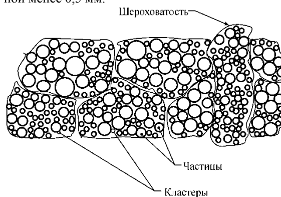
Рис. 2. Система кластеров структурированных частиц

На рис. 2 представлена схема системы кластеров структурированных частиц. Эти кластеры имеют определенные размеры и некоторую самостоятельность. При внешнем воздействии G (прокатка, гидрорезка) на макротело, один из параметров которого, например толщина полосы при прокатке (расстояние) или площадь пятна гидрорезки, а следовательно, и уплотнения (масса), соизмерим с кластером структурированных частиц. Самостоятельные группы СКСЧ имеют свою массу, размеры и время активной «жизни» при внешнем воздействии. С помощью групп СКСЧ можно объяснить образование некоторых неровностей (шероховатостей) при прокате тонкого листа толщиной менее 0,5 мм.