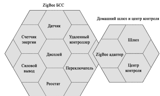
Рис. 5. Разнородная домашняя местная сеть