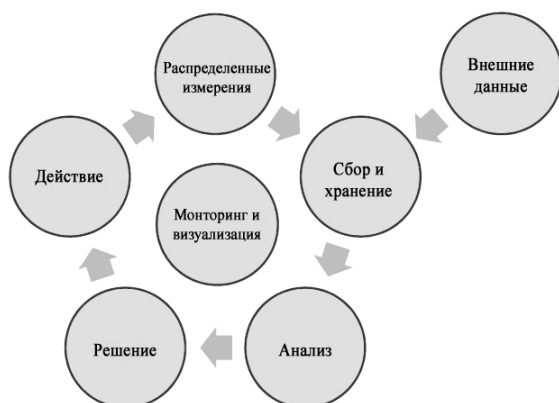
Рис. 2. Схема прохождения информационных потоков

Проведенный анализ позволяет принять правильное управленческое решение.