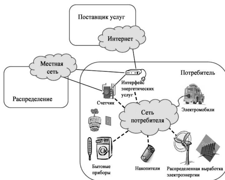
Рис. 1. Сфера обслуживания и ее связи с другими сферами ЛЭС

В блоке анализа собранные и хранящиеся данные изучаются и обрабатываются с целью получения логической и статистической информации о реальном состоянии ЛЭС и возможностей перехода в другое состояние, например аварийное.