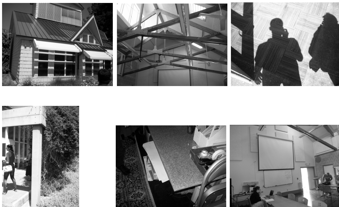
Рис. 1. «Зеленое здание» в Государственном университете Сономы (SSU)

Российская Федерация обладает большими запасами биомассы. В частности, потенциал Уральского федерального округа только для производства пеллет из древесной биомассы составляет 3,0 млн. т у.т. Это производство, по сравнению с другими способами переработки биомассы, пока не имеет широких масштабов. Однако по данным [4] численность заводов по производству пеллет в