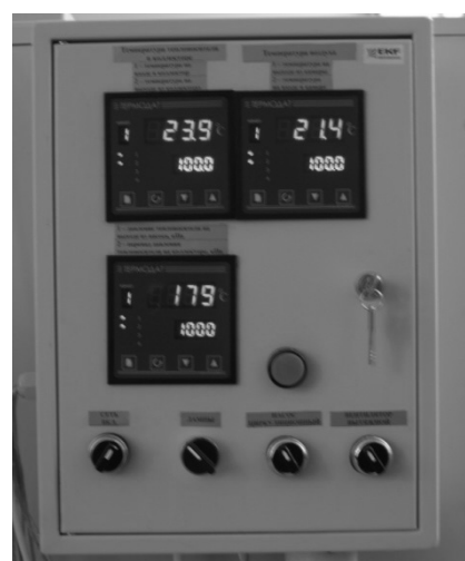
Рис. 3. Панель управления стенда

В процессе работы стенда измерения производятся в следующем порядке: